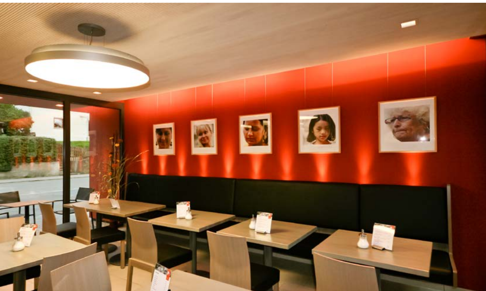
Bild unten: Holz bedeutet nicht immer „rustikal“: Innenansicht des Cafés. Hier wurde das Akustikprofil mit 12 mm breiten, astreinen Leisten und 4 mm breiten Fugen verwendet.

Bild oben: Schemadarstellung der Echtholz-Akustikpaneele LIGNO Akustik light 3S-33.